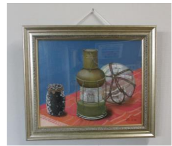
「卓上の静物」木村佳孝氏 作

また、地元にお住いの方から、「友小の児童のために使ってください」と10万円のご寄付をいただきました。児童のためになるような使い道を検討し、ありがたく使わせていただきます。